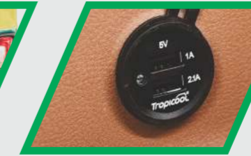
డ్యూయల్ USB ఫాస్ట్ ఛార్జర్