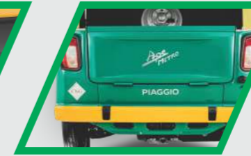
సైలిష్ వెనుక బంపర్