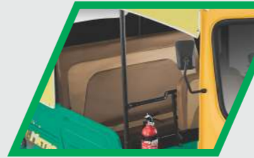
రెండు రంగుల సీట్