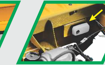
సురక్షిత కోసం ఇంజన్ కంపార్ట్‌మెంట్ లైట్