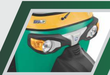
కొత్త డిజైన్ తోపాటు సైలిష్ డిజైన్