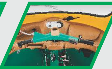
కొత్త ఇంటీరియర్ కొత్త డ్యాష్ బోర్డ్