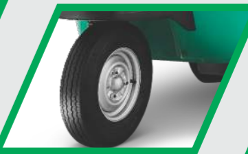
మేలైన పర్ఫార్మెన్స్ మరియు నమ్మకానికై ట్యూబ్‌లెస్ టైర్లు