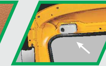
డ్రైవర్ కంపార్ట్‌మెంట్ లైట్