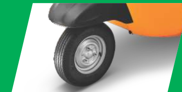
3 ହ୍ୱାଲର ଶ୍ରେଣୀରେ ପ୍ରଥମ ଟ୍ୟୁବଲେସ୍ ଟାୟାର