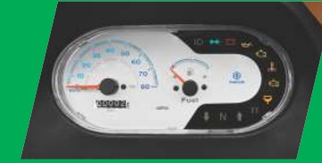
ଏଡଭାନ୍ସଡ଼ ଇନଫର୍ମେଶନ୍ ଡିସ୍ପ୍ଲେ