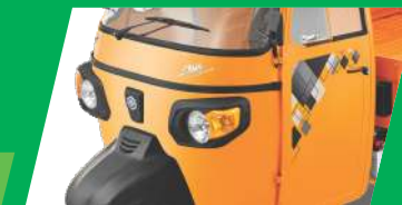
ଆକର୍ଷକ୍ ତିଜାଭନ୍ ଏବଂ ଶୈଳୀ